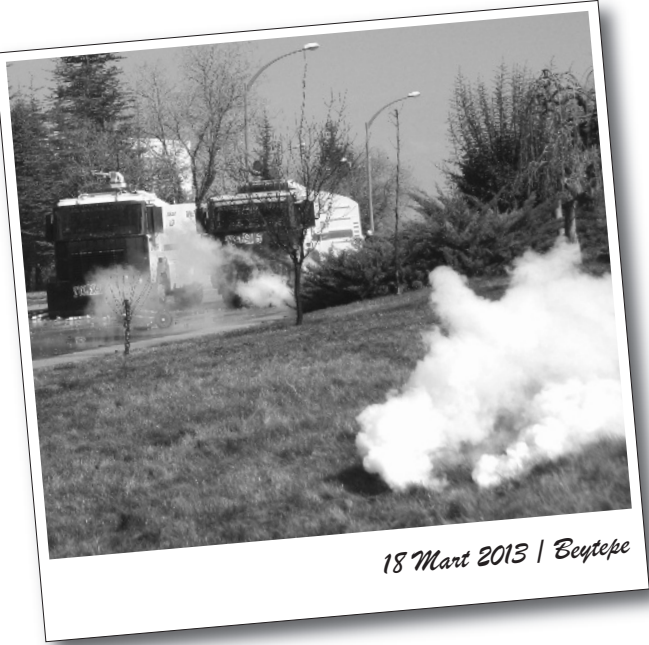
18 Mart 2013 | Beytepe

Geçtiğimiz hafta üniversiteler sivil faşist ve ÖGB saldırıları ile azgın polis terörüne sahne oldu. Ancak her saldırıda gençliğin yanıtı direniş oldu. Sermaye düzeni ise çareyi üniversiteleri tatil etmekte buldu.