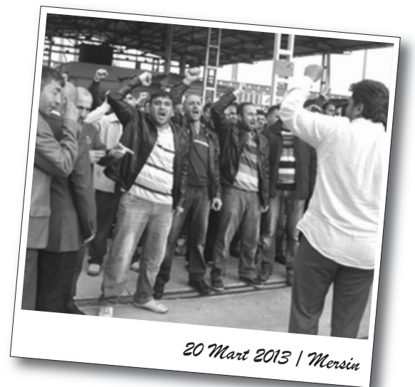
20 Mart 2013 | Mersin

Gıda mühendislerinin yaşadığı mesleki sorunları dile getirmek için 9 Mart'ta başlatılan ve 6 hafta boyunca her Cumartesi tekrarlanacak olan "Gıda mühendisleri istihdam için alanlarda" kampanyası 17 Mart'ta hava muhalefeti dolayısıyla sadece Bornova Metro çıkışında açılan imza standı ile sürdürüldü. Kamuda yeterli sayıda gıda mühendisi istihdam edilmesi, özel sektörde çalışma koşullarının iyileştirilmesi ve üniversitelerde kontenjan artışlarının durdurulması talepleri ile imza standları açarak seslerini duyurmayı amaçlayan gıda mühendisleri yaklaşık 3 saat boyunca toplam 1000 kadar imza topladılar.