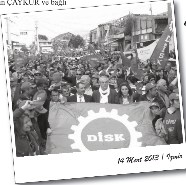
14 Mart 2013 | İzmir

Tek Gıda-İş Sendikası'nın ÇAYKUR ve bağlı işyerlerinde çalışan işçiler adına Kamu İşletmeleri İşverenleri Sendikası ile sürdürdüğü TİS görüşmelerinin akamete uğramasıyla birlikte alınan grev kararı işyerlerinde ilan edildi. İlan edilen grev kararına göre işçiler 10-15 Nisan tarihlerinde greve çıkacaklar. Grev kararının alınmasında, sendikanın yetkisinin önceki yıllarda düşürülerek hak kaybına uğratılması, yetkinin tekrar alınması ile 4 yıl boyunca Çaykur bünyesinde çalışan yaklaşık 10 bin işçinin taleplerin karşılanmaması önemli bir rol oynuyor.