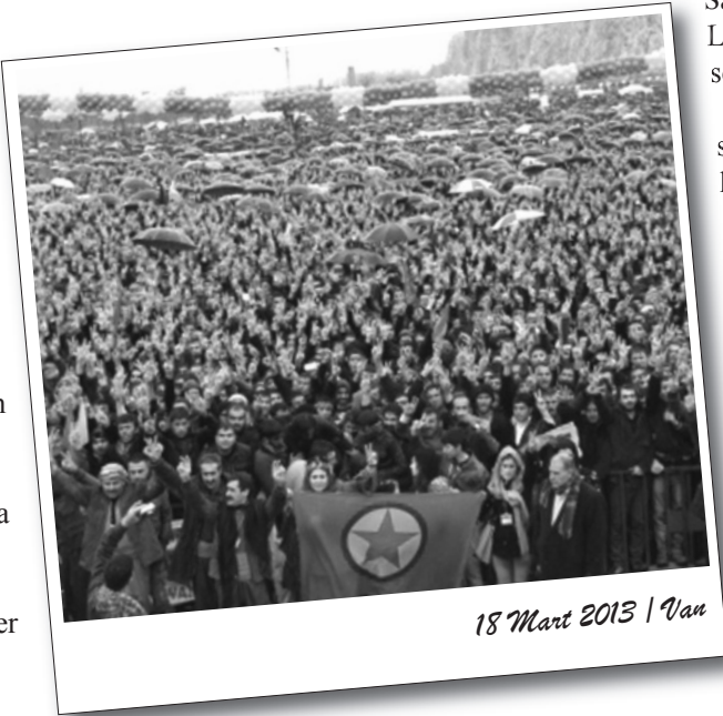
18 Mart 2013 / Van

Manisa ’da kadın ve gençlerin yoğunlukta olduğu kutlama yerel sanatçıların söylediği şarkılar eşliğinde çekilen halaylarla başladı. Yöresel kıyafetler giyerek katılanların dikkat çektiği Newroz’da Manisa’daki yerel sanatçıların yanı sıra Dengbêj Kazo’nun söylediği şarkılar eşliğinde halaylar çekildi.