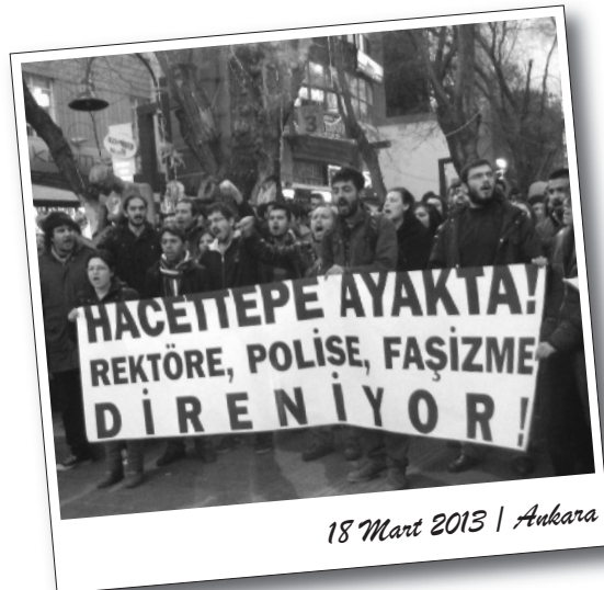
18 Mart 2013 | Ankara

Sivil faşistleri okulun bir köşesinde korumaya alan polis, saldırıda 4 öğrenciyi yaralarken 3 öğrenciyi de gözüaltına aldı.